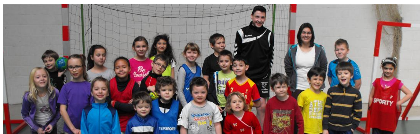
■ Les jeunes ont fait une pause photo entre deux séquences d'entraînement.