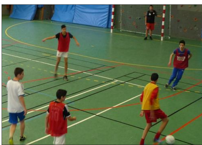
■ Un tournoi de futsal était organisé au gymnase Marcel-Cerdan.