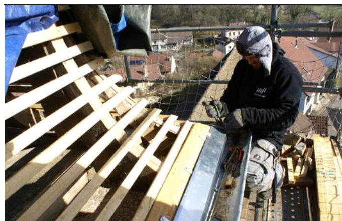
■ Un ouvrier de l'entreprise Franche-Comté de Rioz est, ici, en train de placer la zinguerie du clocher.

RACHETÉ par la mairie pour l'euro symbolique en 2013, le temple de Trémoins est en travaux pour une période évaluée à deux mois.